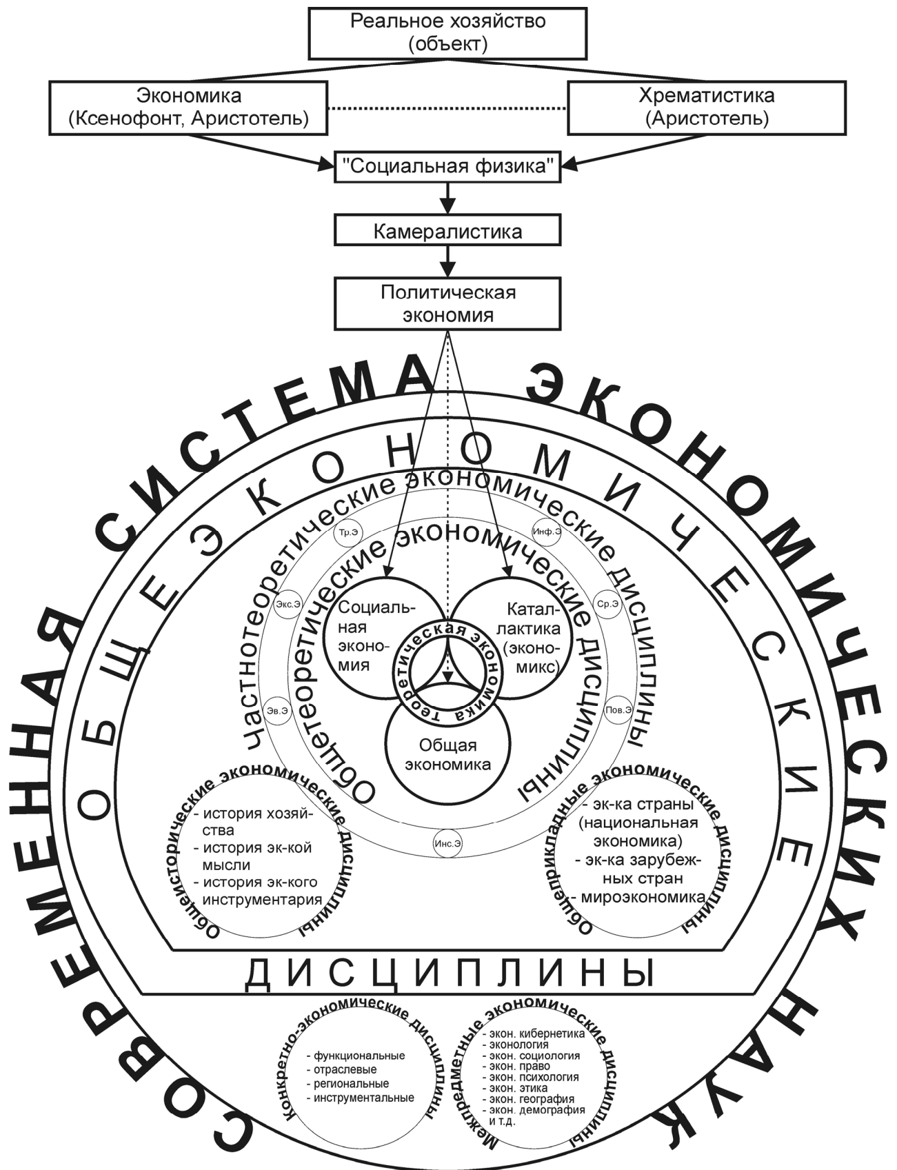
Рис. 1. Место «теоретической экономики» в современной системе экономических наук