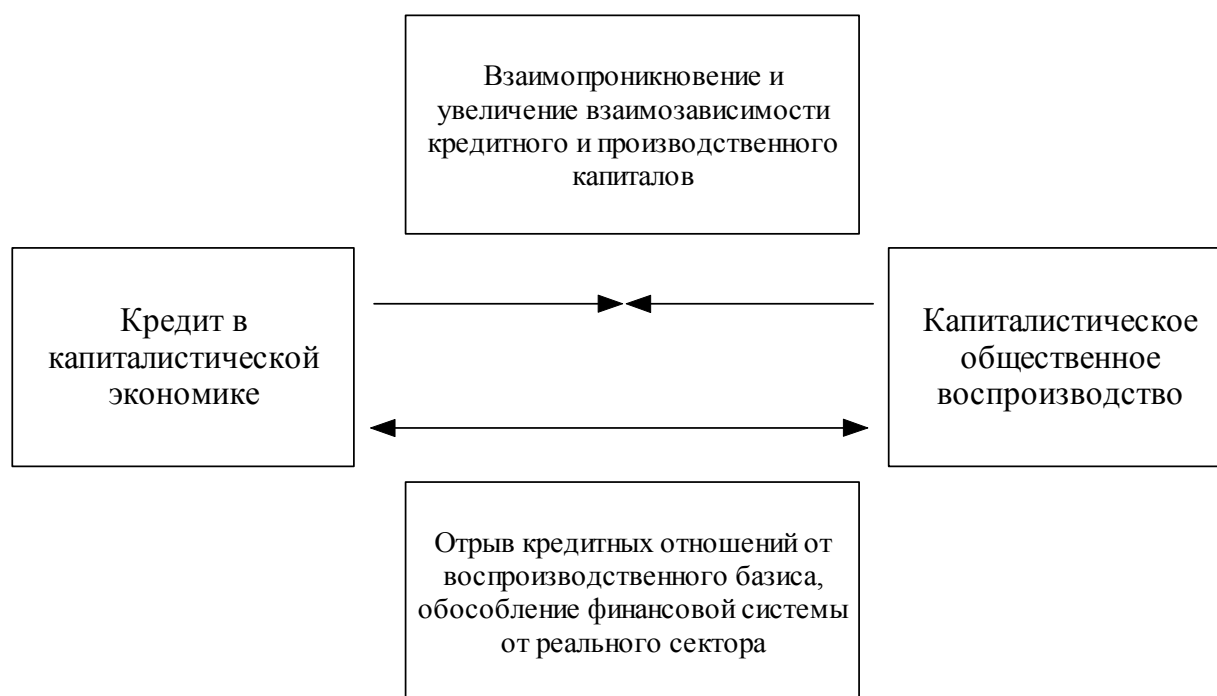
Рис. 1. Схема диалектического развития категории кредита в контексте общественного воспроизводства

Наличие двух противоположных тенденций не является чем-то необычным; напротив, это нормальная схема диалектического развития в соответствии с законом единства и борьбы противоположностей. Наличие диалектического противоречия обуславливает динамичное изменение форм кредитных отношений в современном капитализме.